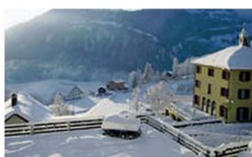
Klimagerechter Umbau in Seewis: Solarenergie wärmt den Wellnessbereich im Hotel Scesaplana (rechts) über dem Prättigau.

Arosa wirbt für «klimaneutrale Winterferien» und kauft zum Ausgleich Zertifikate einer Biogasanlage. Auch mehrere der im Verband christlicher Hotels (VCH) zusammengeschlossenen Ferienhäuser erhielten Energieauszeichnungen und Umweltpreise.