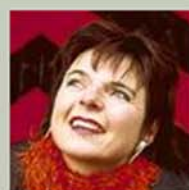
Der grosse Wendepunkt